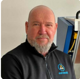
Dr.-Ing. Ino Rass Euromat GmbH